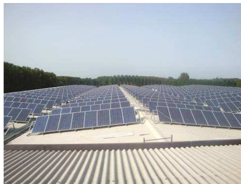
Esempi di impianti non integrati architettonicamente