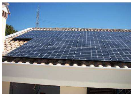
Esempi di impianti parzialmente integrati