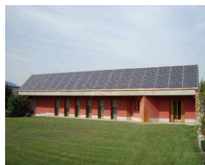
Esempi di impianti integrati architettonicamente